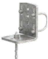
4164 / 4073