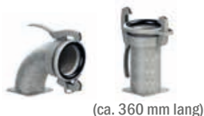
(ca. 360 mm lang)